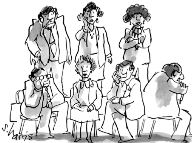
Top Row, L.toR.: Political Angst, Career Angst, Social Angst Bottom Row: Intellectual Angst, Artistic Angst, Sexual Angst, Angst