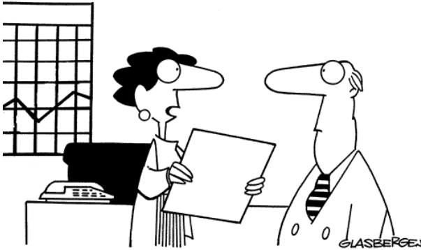
"Our reorganization is finally completed. Our old disorganized system has been replaced by our new disorganized system."

© 1999 Randy Glasbergen. www.glasbergen.com