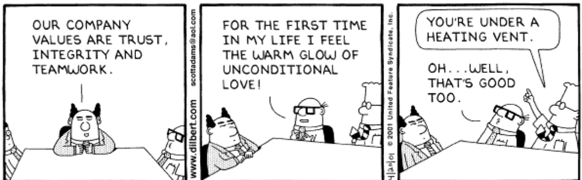
Copyright © 2001 United Feature Syndicate, Inc. Redistribution in whole or in part prohibited

"I downsized our staff so effectively, they promoted me to Executive Vice President. They also made me custodian, receptionist and parking garage attendant."