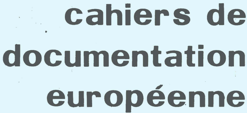
TABLE DES MATIERES ANNEES 1966-1969