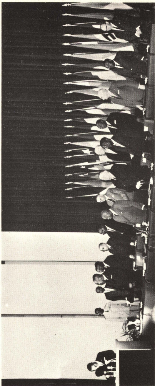
Séance solennelle d'ouverture au grand amphithéâtre de l'Université de Tananarive