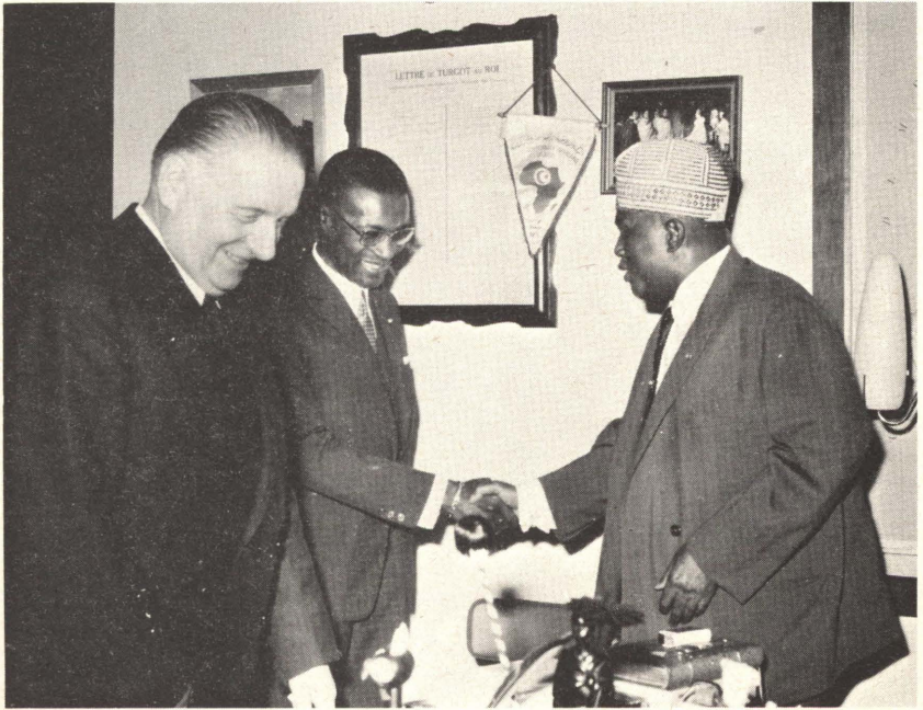
MM. Philippe YACE et Alain POHER reçus par M. Philibert TSIRANANA, Président de la République malgache