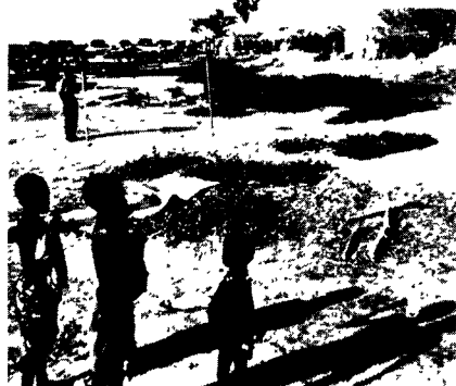
A region in Africa which will receive EC aid

The large influx of refugees has worsened food shortages in the host countries, especially Zambia. The EC plans to send Zambia 6,000 tons of white maize; this would be in addition to earlier commitments to provide 10,000 tons of maize and 6,000 tons of wheat.