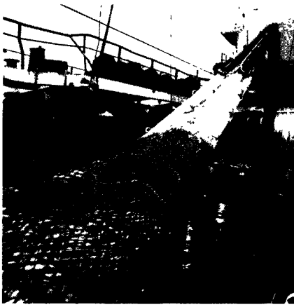
The EC is a large, potential market for Canadian fish