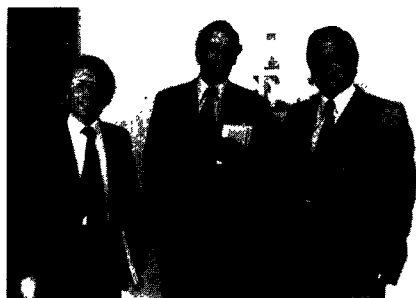
EC Commissioner for Industrial Affairs, Viscount Etienne Davignon (centre), with Ontario's Minister for Industry and Tourism, Larry Grossman (left), and Ontario's Premier William Davis (right), in Brussels on 17 September

L'objectif de -5 millions de tonnes pour le Royaume-Uni reflète l'auto-suffisance en pétrole qui résultera bientôt de la production pétrolière en Mer du Nord.