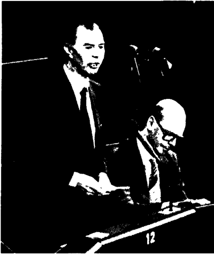
Mr. Leo Tindemans (standing), former Prime Minister of Belgium, who was one of the Euro-MPs to propose a new EC treaty