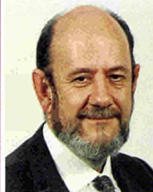
José María Gil Robles Presidente del Parlamento Europeo